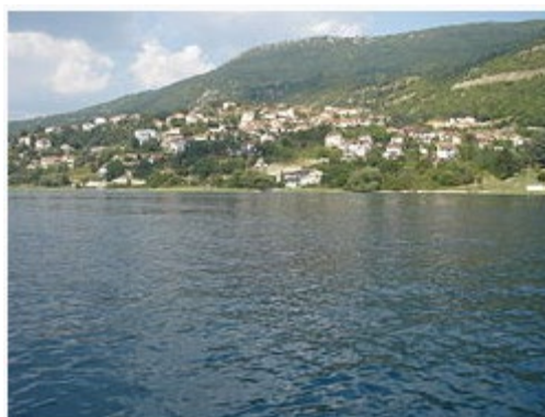
Глетка на Долно Коњско од водите на Охридското Езеро

Долно Коњско се наоѓа јужно од градот Охрид, над патот Охрид - Св. Наум и во непосредна близина на Охридското Езеро. Оваа населба е оддалечена