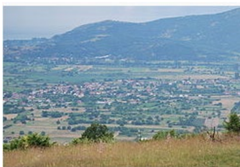
Панорама на Лескоец

Селото Лескоец се наоѓа на 4,1 км. оддалеченост од Охрид и во моментот представува приградска населба на градот Охрид, со развиена индустриска зона